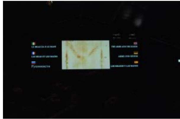
Rechts de wonden op de armen