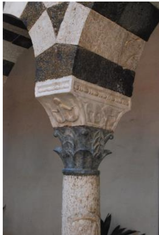
Foto's van klooster in Torri