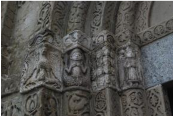
Een van de Sirenen aangetroffen Op het Timpaan van de St. Michaels kerk in Pavia