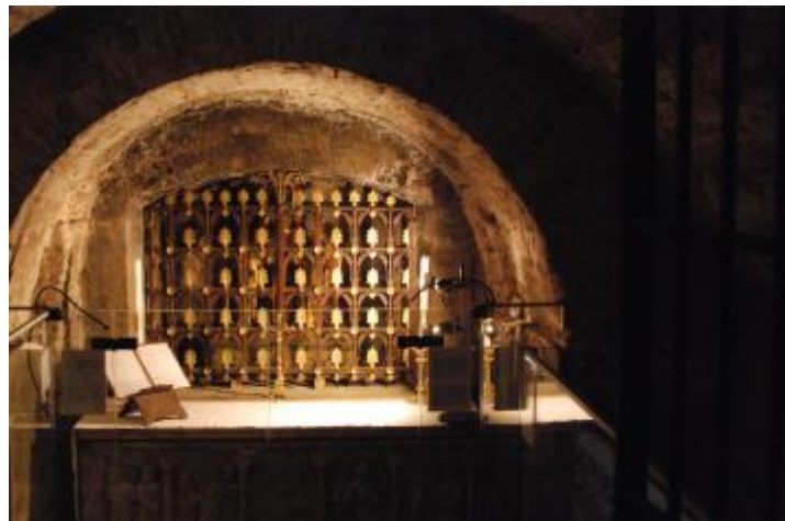
Nis met de schedel