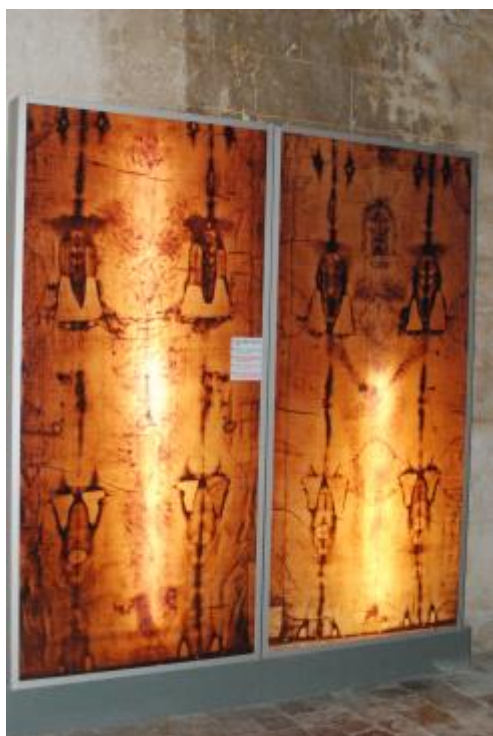
Paneel met foto van de Lijkwade

Maar het bijzondere van het bezoek aan de basiliek was wel dat er een expositie over de Lijkwade van Turijn opgesteld stond. Deze stond er verleden jaar ook maar toen hadden we er weinig aandacht aan besteed. Deze keer natuurlijk wel. Uitgebreid foto's genomen van de meeste borden met uitleg. Is dit Toeval , nee maar Synchroniciteit . Door de expositie krijg je toch meer informatie voordat je de echte Lijkwade gaat bezichtigen.