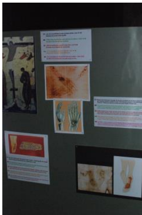
Een van de panelen met Informatie over de Lijkwade

Nu vol verwachting op weg naar Turijn. We verbleven niet op een camping in Turijn maar op een klein plaatsje vlakbij. Hiervandaan was het makkelijk om naar Turijn te gaan. Op 30 april gingen we de Lijkwade bekijken. We moesten ons melden op de juiste tijd zoals op de toegangkaart stond vermeld.