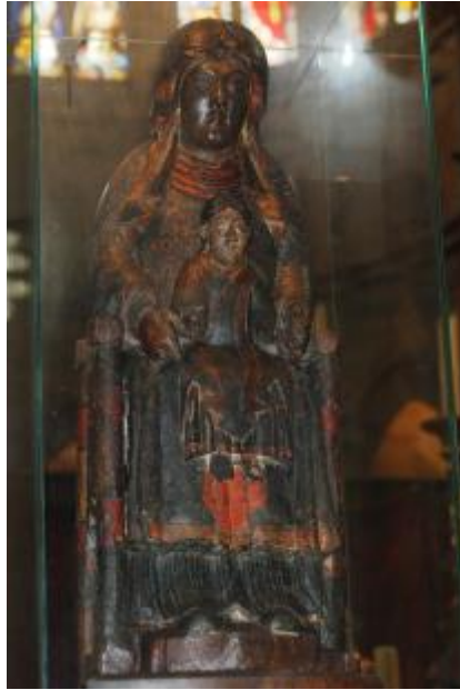
Zwarte Madonna van Beaune