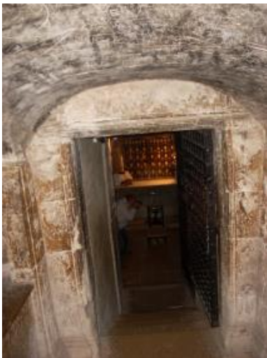
Crypte met de nis voor de Schedel