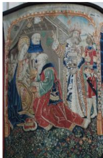
Aanbidding drie koningen

Dit zijn twee voorbeelden van het tapijt