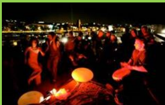
Lichtpiramide boven NEMO Amsterdam, 2006